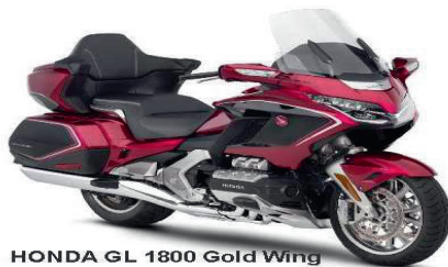
HONDA GL 1800 Gold Wing

E-mail : info@motosport-ge.ch www.motosport-ge.ch