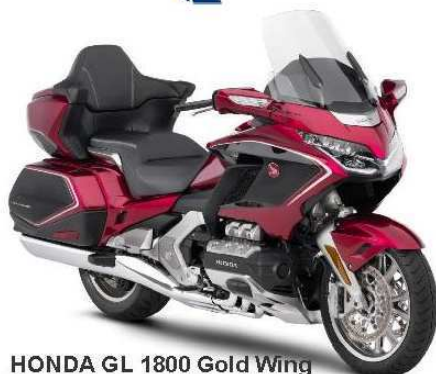
HONDA GL 1800 Gold Wing