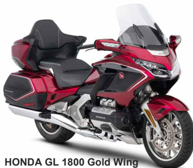
HONDA GL 1800 Gold Wing